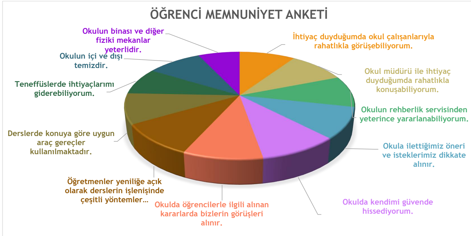
Şekil 1: Öğrenci Memnuniyet Anket Sonuçları

Yapılan öğrenci memnuniyet anketi sonucunda öğrencilerimizin genel memnuniyet düzeyinin %94 üzerinde olduğu görülmektedir. Öğrencilerimiz en çok okul idaresi, öğretmenlerden memnun olduklarını belirtmişlerdir. Ancak binamızın dönüştürülerek okul yapılması sebebi ile bazı olumsuzlukları içinde barındırdığı görülmüştür.