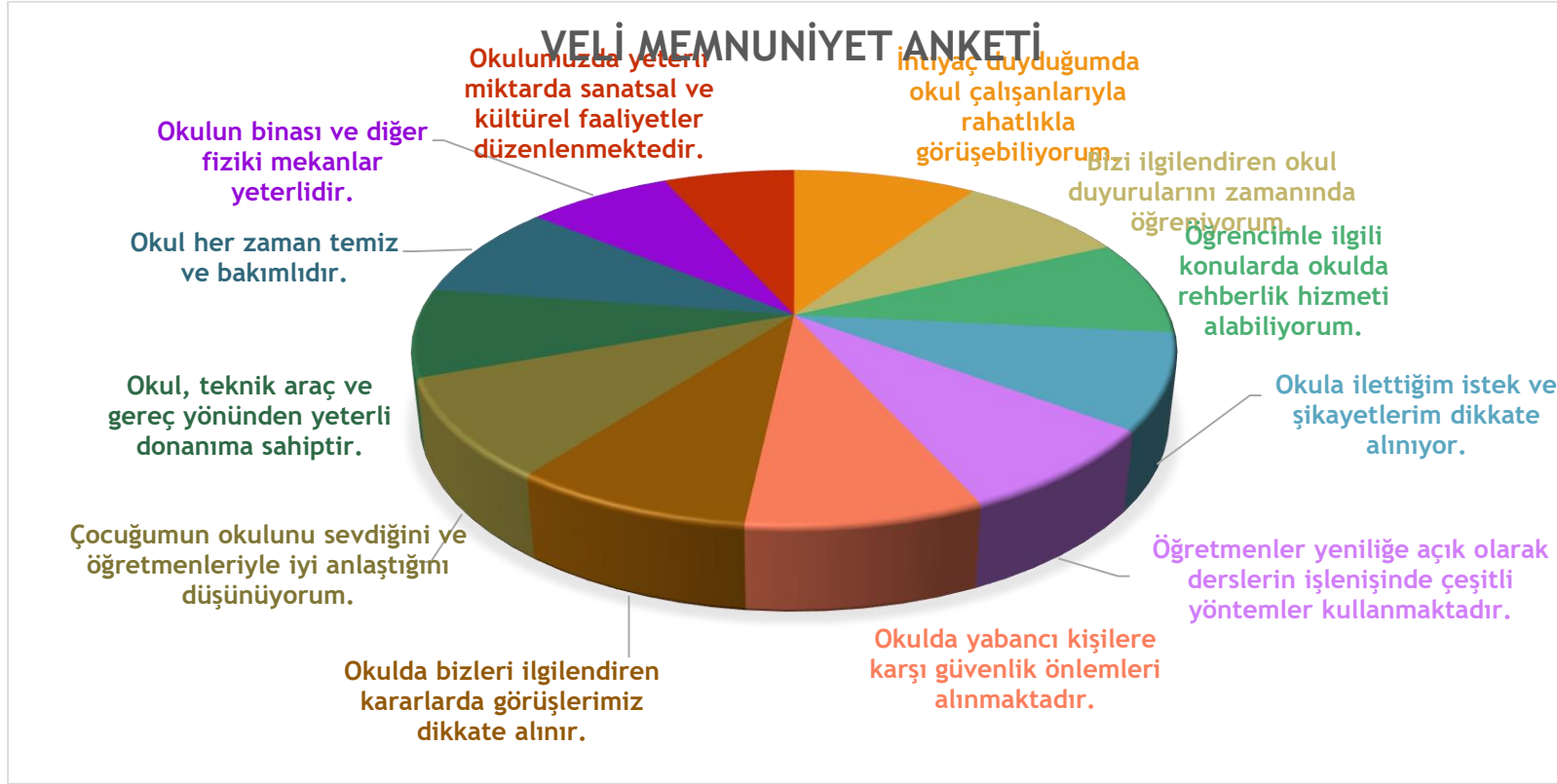
Şekil 3: Veli Memnuniyet Anket Sonuçları

Yapılan veli memnuniyet anketi sonucunda velilerimizin genel memnuniyet düzeyinin yüksek olduğu görülmektedir. Velilerimiz en çok öğretmen-öğrenci ilişkilerinden, öğretmenlerin donanımlı olmasından, idarenin yaklaşımından vb. memnun olduklarını belirtmişlerdir. Ancak okul formatı gereği veli ve öğrencilerimizle yeterli sanatsal ve kültürel faaliyetler yapılamadığı görülmüştür.