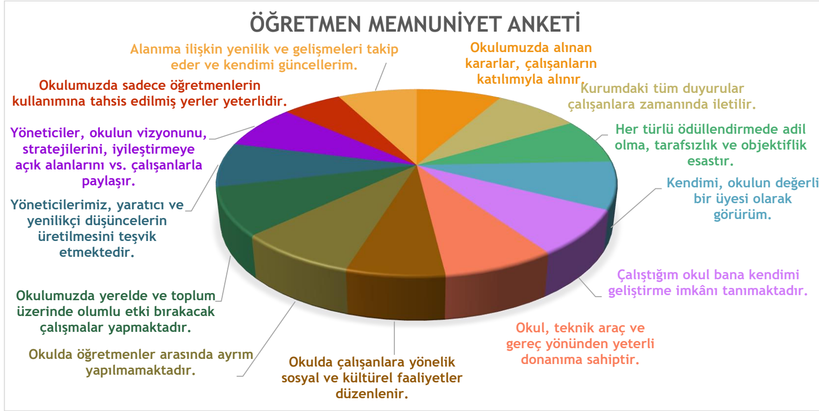
Şekil 2: Öğretmen Memnuniyet Anket Sonuçları

Yapılan öğretmen memnuniyet anketi sonucunda öğretmenlerimizin genel memnuniyet düzeyinin % 93 dolaylarında olduğu görülmektedir. Öğretmenlerimiz en çok ekip ruhu, kurum içi iletişim, yeniliğe açık olma, kendi görüşlerine değer verilmesi ... gibi faaliyetlerinden memnun olduklarını belirtmişlerdir. Ancak Okulumuzun fiziksel anlamda geliştirilmesi konularının gelişime açık alanlar olduğuna yönelik görüş bildirmişlerdir.